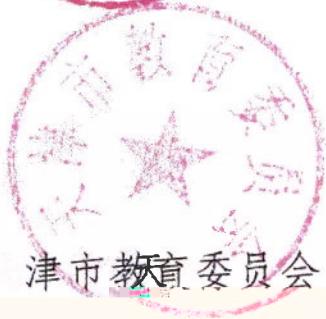
天津市教育委员会