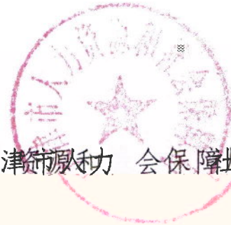
天津市人力资源和社会保障局